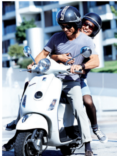
Gesunde Lymphe für ein aktives Leben.

Hierzu zählen die Bausteine: Manuelle Lymphdrainage (MLD), die entsprechende Hautpflege, Bewegungstherapie und eine professionelle Kompressionstherapie.