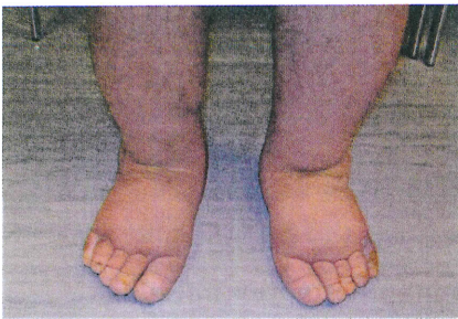
Durch eine starke lymphatische Insuffizienz kommt es bei dem Patienten trotz Kompressionsstrümpfen im Laufe des Tages zu Umfangsveränderungen.