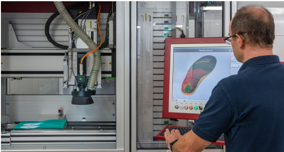
Einzigartige CAD-Fräse in den Frohnhäuser-Werkstätten.

Das Sanitätshaus Frohnhäuser ist spezialisiert auf die Herstellung hochwirksamer Einlagen. Unsere Experten der Orthopädie-Schuhtechnik haben mit den Firmen Isel und Gbion eine in Deutschland einzigartige CAD-Fräse entwickelt.